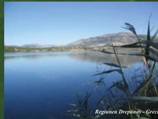
Regiunea Drepanos - Grecia