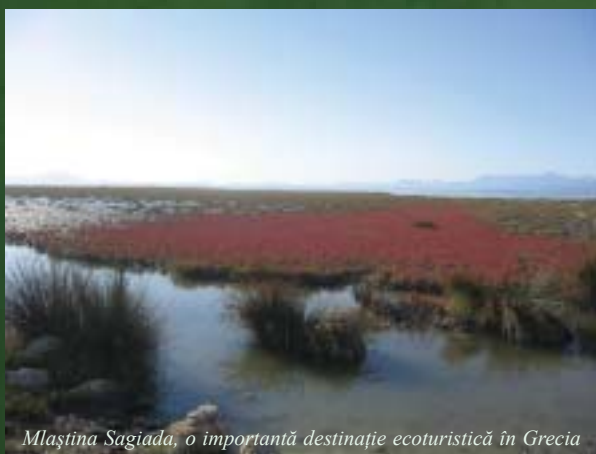
Mlaștina Sagiada, o importantă destinație ecoturistică în Grecia