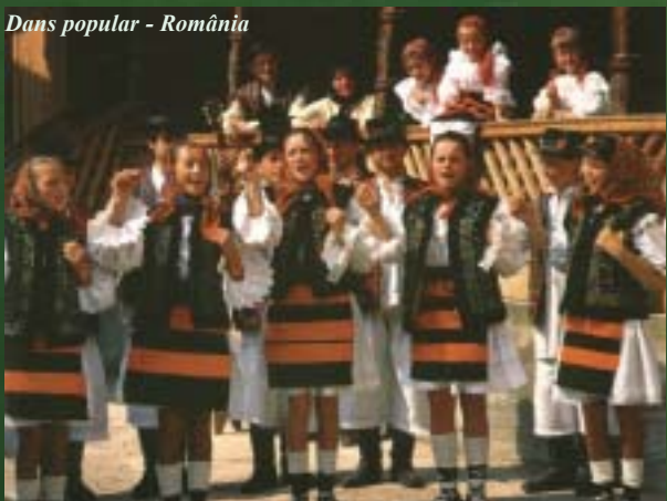
Dans popular - România

Proiectul ECO-ROUTE are ca și scop introducerea unui sistem de certificare la nivel european și sprijinirea comunităților locale privind creșterea capacității acestora în aplicarea în practică a unui asemenea sistem.