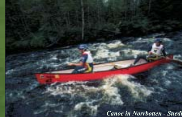
Canoe in Norrbotten - Suedia