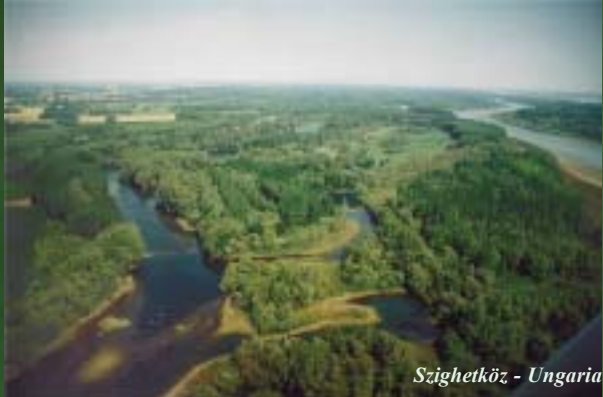
Szighetköz - Ungaria